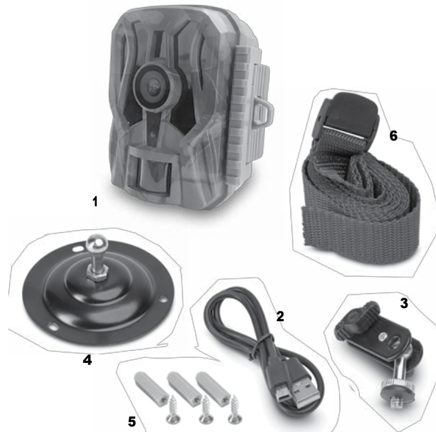
Wild Guardian kasutusjuhend